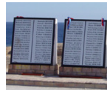
Pomník nehody v Šarm aš-Šajchu (leden 2004)