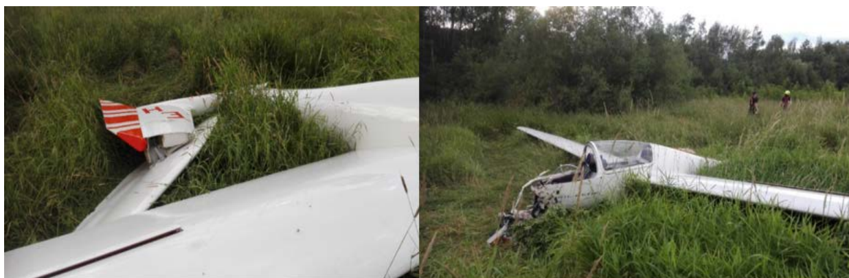
Obr. č. 4: Kluzák na místě nárazu do země

Ohledání kluzáku bylo provedeno v místě letecké nehody. Zničený kluzák ležel na místě nárazu otočen přídílí proti směru přiletu o cca 180°. Přední část trupu byla značně poškozena nárazem do země pod velkým úhlem, kdy došlo k rozdrčení přední pilotní kabiny do hloubky 90 cm. Náběžná hrana levé poloviny křídla byla po kontaktu s korunou stromu rozdrčena v délce 140 cm od okraje křídla. Po nárazu kluzáku do země došlo ke zlomení ocasní části trupu ve vzdálenosti 240 cm od odtokové hrany směrového kormidla. Dopadem ocasní části trupu na zem došlo k vylomení vodorovné ocasní plochy ze závěsu kýlové plochy. Ta zůstala ležet pravou polovinou pod ocasní částí trupu a levou polovinou pod pravou polovinou křídla.