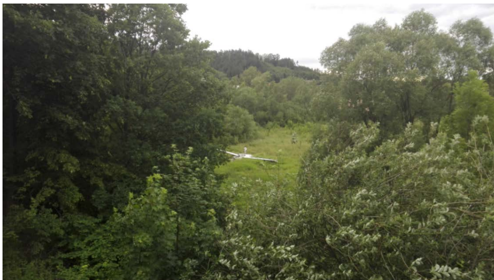
Obr. č. 1: Pohled z jihu na místo přistání ze směru přiletu

Pilot kluzáku provedl jeho vypnutí od vlečného letounu západně od horského masivu Ondřejník ve výšce 1000 m AMSL. Po několika minutách letu dostoupal na výšku 1200 m AMSL a zahájil přiblížení na LKFR. Po přelétnutí vrcholu Ondřejník se kluzák dostal do extrémně silného klesání, které znemožnilo dolétnutí na plánované letiště. Pilot doslova uvedl: „Ondřejník jsem přelétl zhruba v prodloužené ose dráhy LKFR. Následovalo mimořádně silné klesání, které odhaduji na 10 až 20 m·s -1 , protože variometry ukazovaly maximální hodnoty na stupnicích. Po vytracení zhruba poloviny výšky mě bylo již jasné, že na letiště nedoletím a tak jsem kluzák stácel na sever, kde byly možné plochy na přistání do terénu. Během dalších několika desítek sekund mi bylo jasné, že při tomto opadání nedosáhnu na slušnou plochu na přistání. Jako jediná, na kterou možná doletím, se mi zdála loučka za stromořadím u nájezdu na čtyřproudou komunikaci z Frenštátu do Frýdku. Opadání s přibližujícím se povrchem sláblo a kluzák prolétl vrchními větvemi stromořadí a dopadl za toto stromořadí do měkkého terénu“.