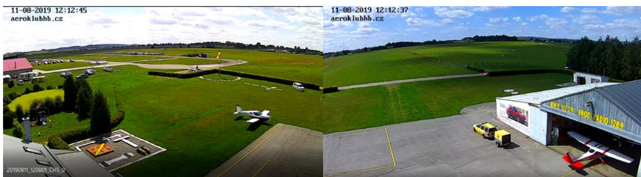
Obr. 4 - Záběr bezpečnostní kamery (vlevo směr na jihovýchod, vpravo na jihozápad)