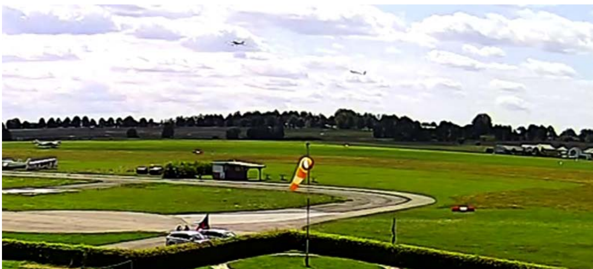
Obr. 5 - Aerovlek ve strmém stoupání v čase 10:12:45

V této fázi letu se kluzák nacházel vlevo od osy za vlečným UL letounem a poloha kluzáku byla v tento okamžik vůči vlečnému UL letounu tak nepříznivá, že měl pilot kluzáku vypnout vlečné lano. Přerušení letu v této fázi letu by umožnilo pilotovi kluzáku bezpečně přistát před sebe na RWY 11. Pilot kluzáku však lano nevypnul a aerovlek pokračoval v relativně strmém stoupání na malé rychlosti. Kluzák letěl výrazně pod vrtulovým vírem a tah vlečného lana negativně ovlivňoval jak let kluzáku, tak i vlečného UL letounu. Vertikální složka tahu vlečného lana táhla zadní část vlečného UL letounu směrem dolů. Z tohoto důvodu se pilotovi vlečného UL letounu v průběhu stoupání nepodařilo zmenšit úhel náběhu a následně zvýšit rychlost aerovleku na požadovanou. A proto, když zahlédl kluzák v levém ostrém náklonu, provedl okamžité vypnutí vlečného lana od vlečného UL letounu. Kluzák z výšky cca 50 m nad letištěm přešel do pádu a v levé vývrtce narazil do země. Vlečný UL letoun po získání rychlosti pokračoval v letu po okruhu a následně bezpečně přistál na RWY 11 LKHB.