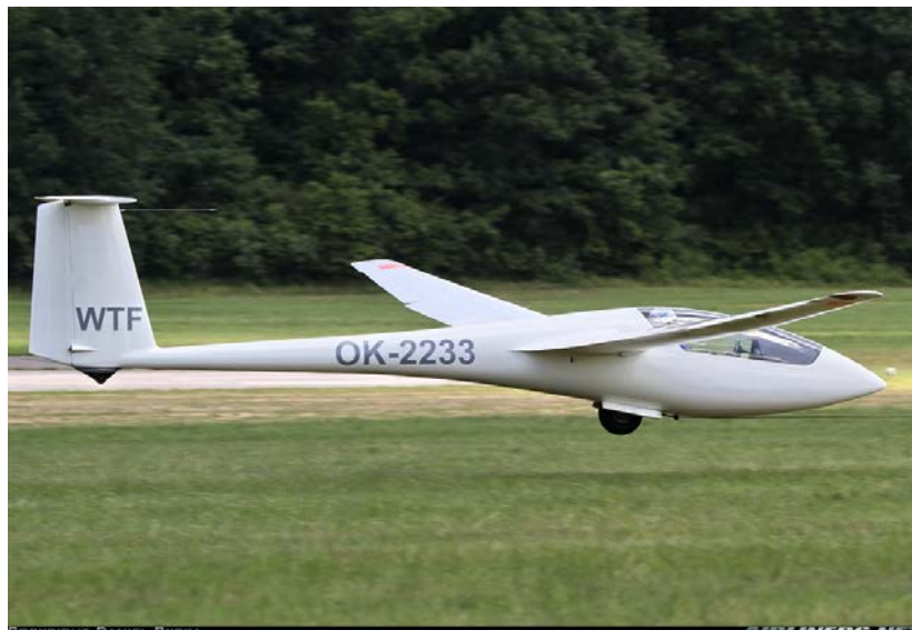
Obr. 2 - Kluzák ASW-19 B při vzletu—ilustrační foto