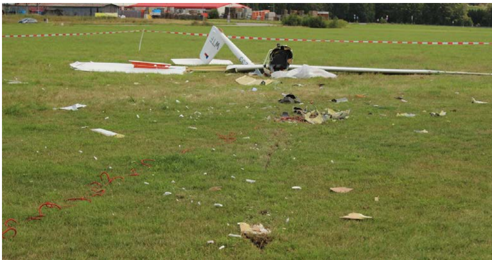
Obr. 1 - Trosky kluzáku ASW-19 B