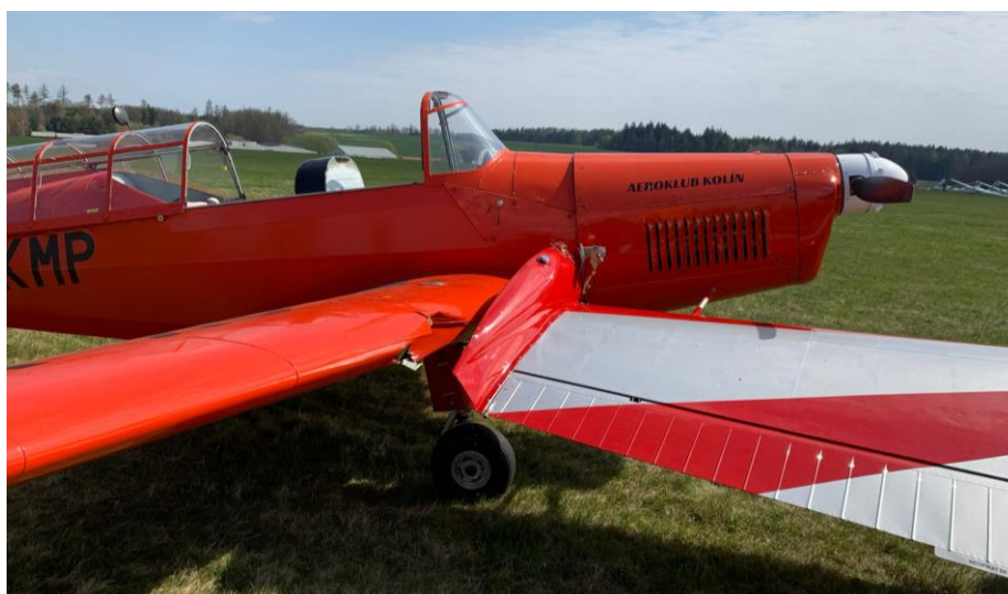
Obr. 1 – Letadlo Zlín Z 226 OK-KMP po nárazu do zaparkovaného Zlínu Z 526 ASF-V OK-CXB.

Pilot pojíždějícího letadla Zlín Z 226 OK-KMP k události uvedl: „Dne 28. 4. 2022 jsem v 8:35 odstartoval z LKKO k letu na LKZB, kde jsem měl vlekat větroně na probíhajících závodech AZ CUP. Po navázání spojení jsem přistál na dráhu 15 ve Zbraslavicích. Po přistání v 8:43 jsem vyjel z dráhy 15 doprava a pokračoval v pojíždění na stanoviště parkujících vlečných letadel, připravených před startem do disciplíny z dráhy 33. Na tomto stanovišti byla již dvě vlečná letadla, já jsem si bohužel všimnul jen jednoho, druhé stálo vedle, ale asi o 5 metrů vzaději, do kterého jsem po několika vteřinách narazil. Při nárazu došlo k poškození obou letadel. Já jsem letěl se Z 226 OK – KMP, druhé poškozené letadlo byl Z 526 OK – CXB. Po vypnutí motoru a jističů jsem ihned zavřel palivový kohout, poněvadž jsem narazil pravým křídlem oblastí palivové nádrže do palivové nádrže Z 526. Ihned jsem vystoupil z letadla a zjišťoval rozsah poškození.“