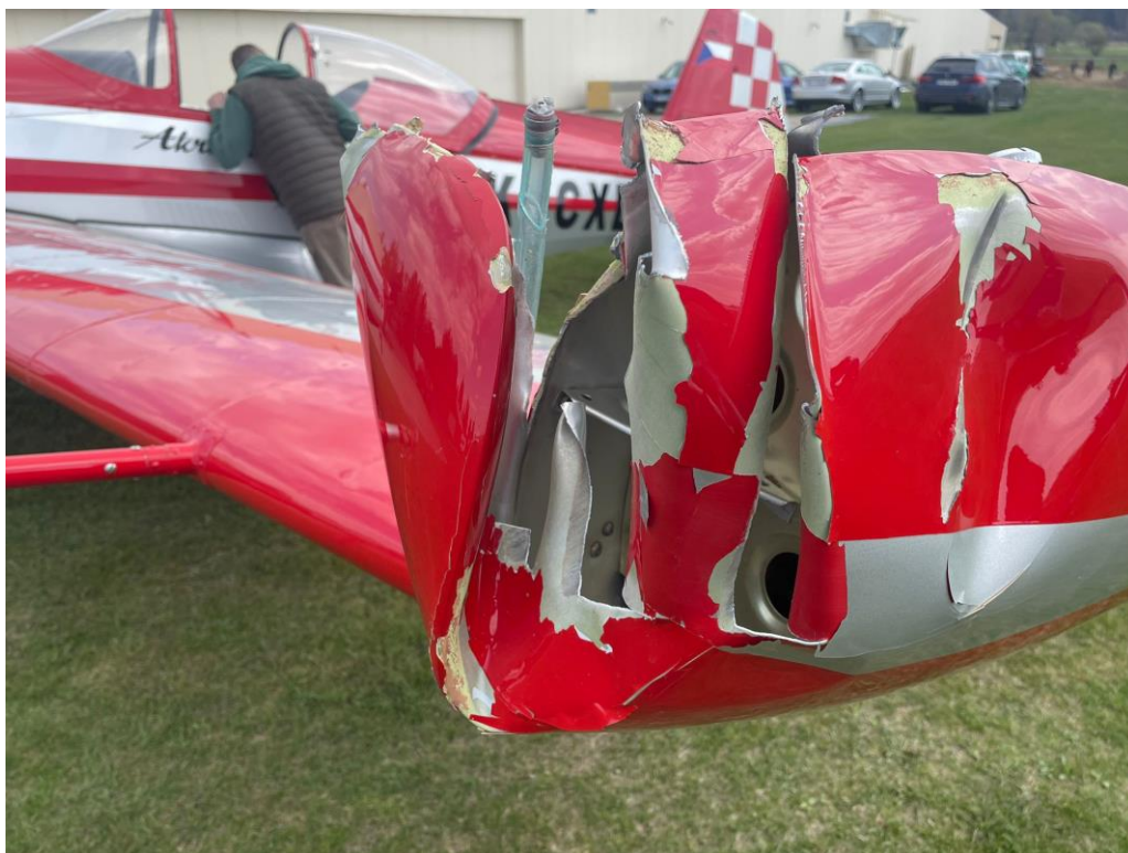
Obr. 6 – Poškození levé poloviny křídla letadla Zlínu Z 526 ASF-V OK-CXB.