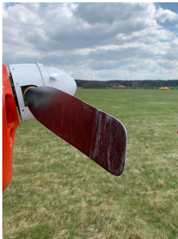
Obr. 4, 5 – Poškození pravé poloviny křídla a vrtule Zlínu Z 226 OK-KMP.