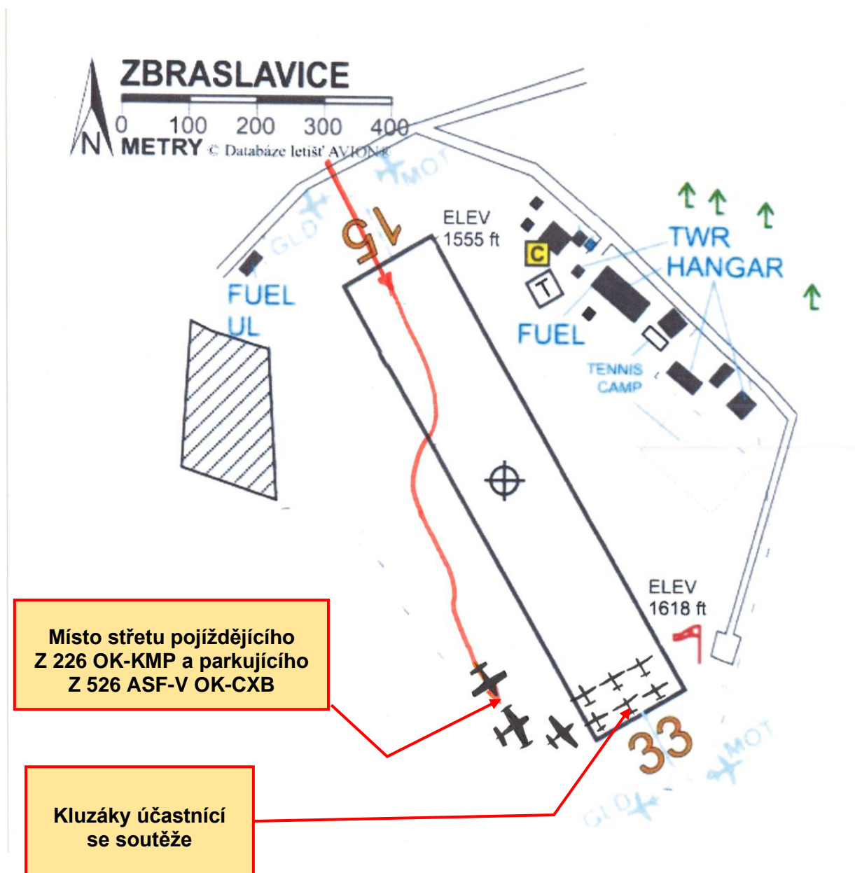
Obr. 3 – Plánek zhotovený pilotem letadla Zlín Z 226 OK-KMP s nákresem trajektorie poježdění a místa nehody.

Vyjma poškození obou letadel k žádným dalším škodám nedošlo a ÚZPLN nebyly žádné škody do zpracování závěrečné zprávy nahlášeny.